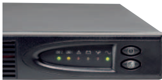
Frontblende der 5115