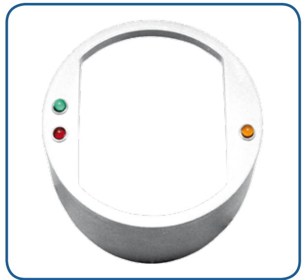
Abdeckung rund Ku + Alarm LED, weiß 11610014