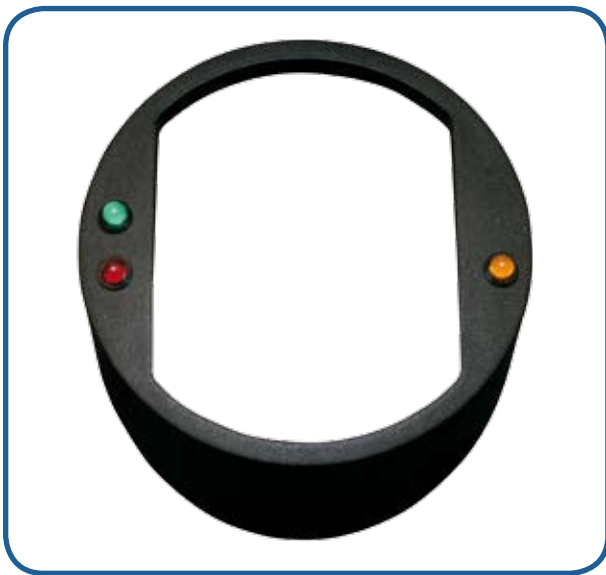
Abdeckung rund Ku + Alarm LED, anthrazit 11610013